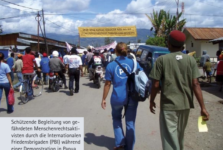
Schützende Begleitung von gefährdeten Menschenrechtsaktivisten durch die Internationalen Friedensbrigaden (PBI) während einer Demonstration in Papua.