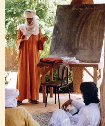
Konfliktanalyse während eines Trainings in Niger.