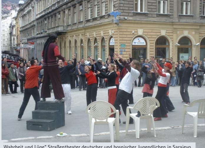
„Wahrheit und Lüge“ Straßentheater deutscher und bosnischer Jugendlichen in Sarajevo.