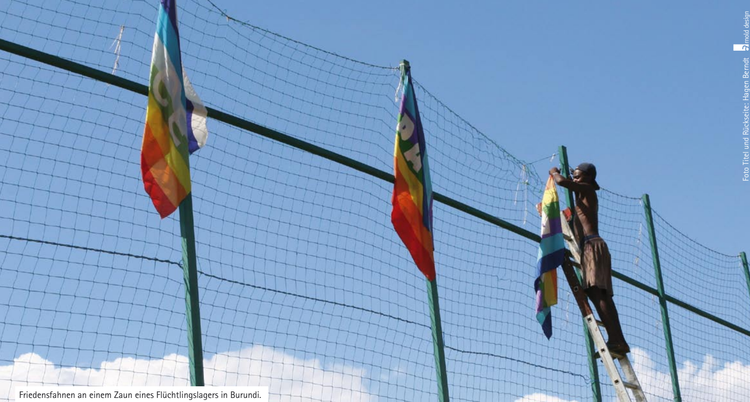
Friedensfahnen an einem Zaun eines Flüchtlingslagers in Burundi.