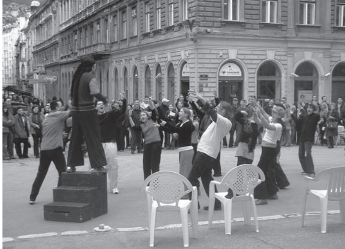
„Wahrheit und Lüge“ Straßentheater deutscher und bosnischer Jugendlichen in Sarajevo.

Mit der ZKB hat sich Friedenshandeln in gutem Sinne professionalisiert. Die Erfahrungen, die von deutschen – auch kirchlichen – Nichtregierungsorganisationen gesammelt wurden, haben Modellcharakter und sind es wert diskutiert zu werden. Zugleich besteht die Gefahr, dass gewaltfreie Konfliktbearbeitung nicht als friedenspolitische Alternative, sondern als „Erweiterung“ oder Ergänzung militärischer Einsätze verstanden wird und dass die Entwicklung im Bereich der ZKB nicht mehr ausreichend von den Initiatoren – auch in der ökumenischen Bewegung und den Kirchen – verfolgt und (kritisch) begleitet wird.