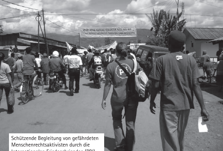
Schützende Begleitung von gefährdeten Menschenrechtsaktivisten durch die Internationalen Friedensbrigaden (PBI) während einer Demonstration in Papua.