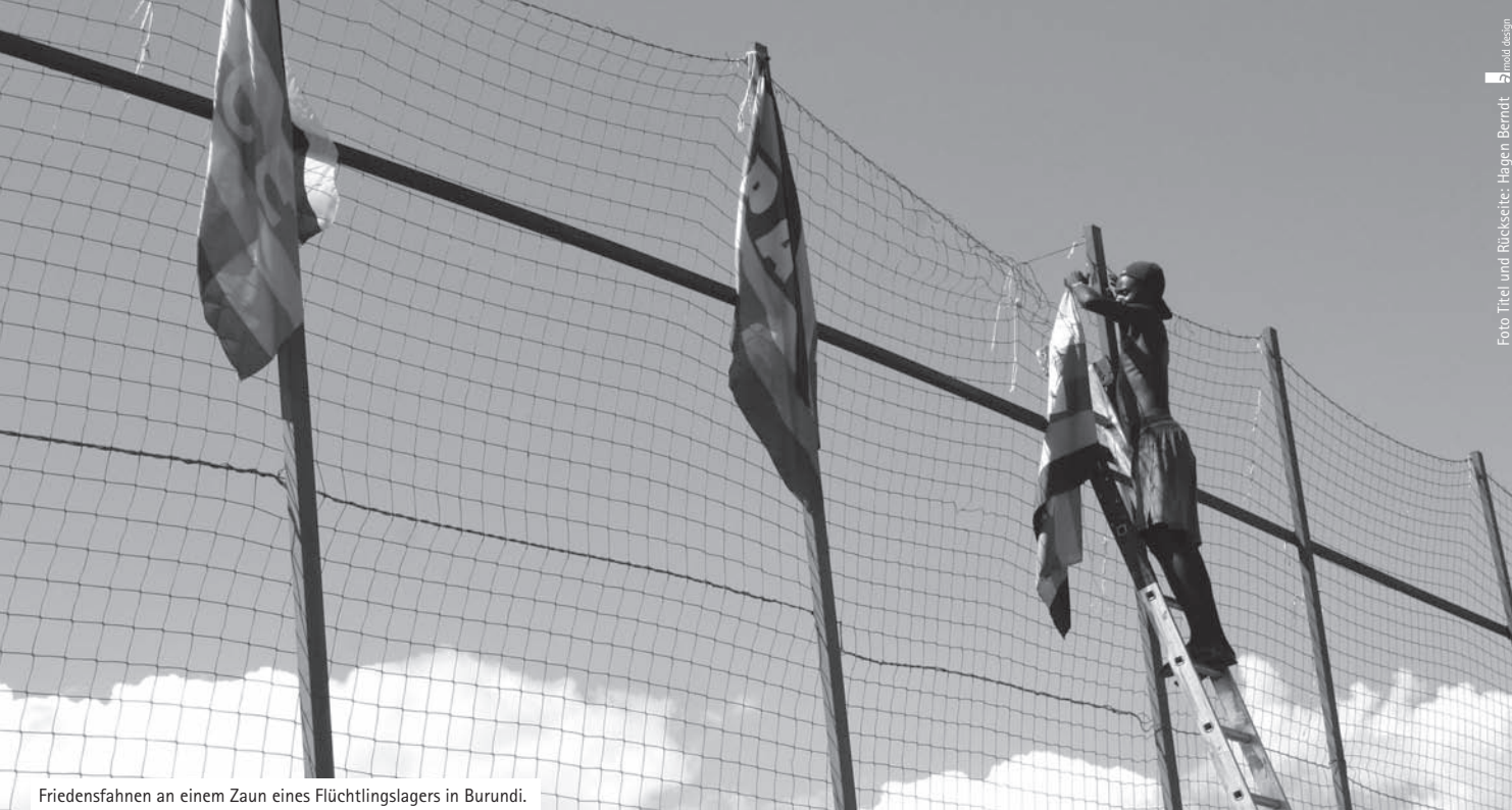
Friedensfahnen an einem Zaun eines Flüchtlingslagers in Burundi.